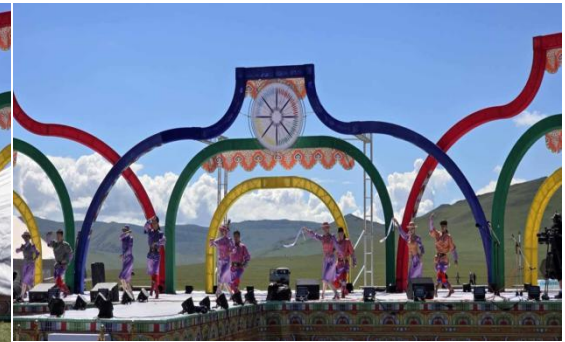
Оролцсон 38 өвлөн уламжлагчаа фестивалийн үеэр “Үзэсгэлэнт горхи тэрэлж” амралтын газар байрлуулсан.